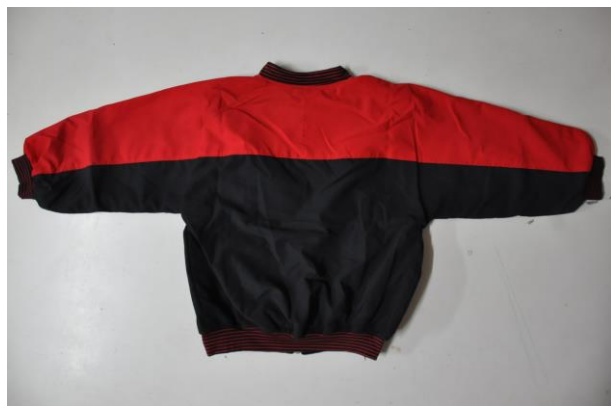
冬季體育外套背面

說明：黑色外套，胸口以上為紅色，中央附黑色拉鍊。衣領、袖口、下擺加紅黑相間收縮布料。左右各加一斜口口袋。