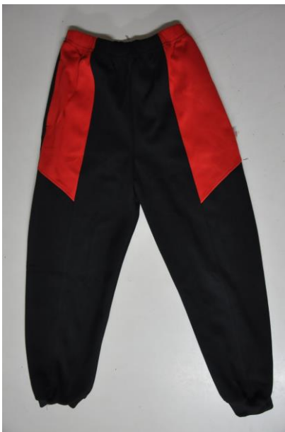
冬季體育長褲正面