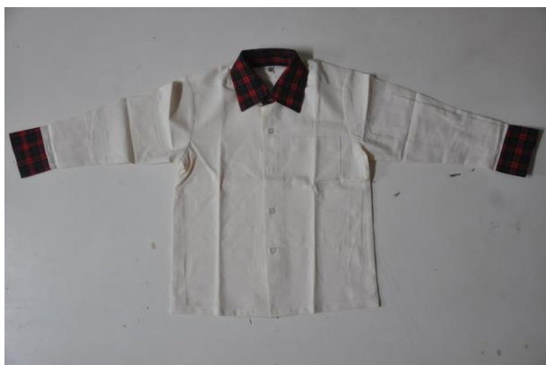
冬季制服上衣正面