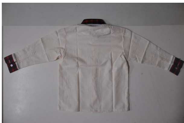
冬季制服上衣背面