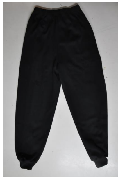
冬季體育長褲背面