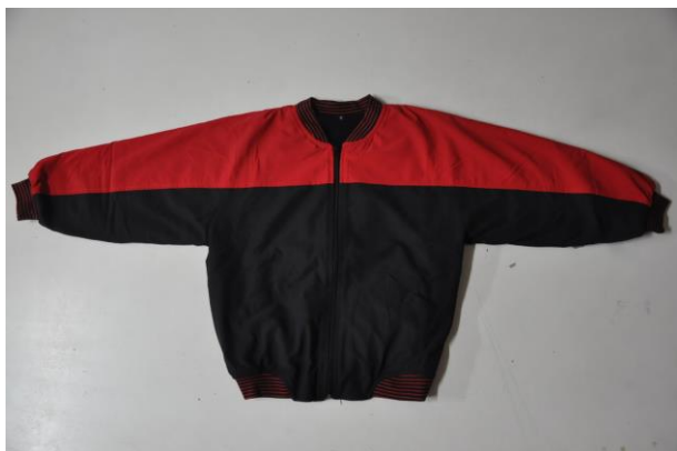
冬季體育外套正面

說明：黑色外套，胸口以上為紅色，中央附黑色拉鍊。衣領、袖口、下擺加紅黑相間收縮布料。左右各加一斜口口袋。